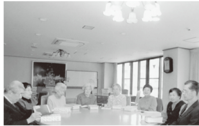
ベタニア祈り会 毎月第一月曜 2015年1月は5日(月)です。