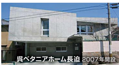
呉ベタニアホーム長迫 2007年開設